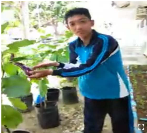
Gambar 2: Salah satu contoh video pembelajaran yang telah direkan dan diunggah pada laman YouTube ( https://youtu.be/on4_ZZVMMMMcRw )